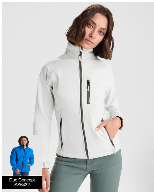
Duo Concept SS6432