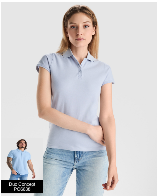
Duo Concept PO6638